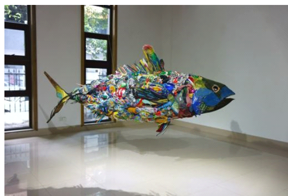
「淀川テクニック」によるゴミを再利用した大型作品『さざれ魚』

©Yodogawa Technique Courtesy of YUKARI ART