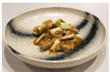
白ネギと照り焼きチキン