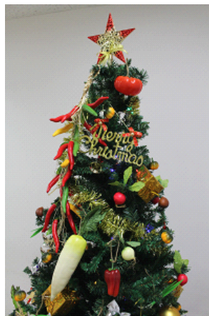
京野菜のオーナメントで飾られた 「京野菜ツリー」