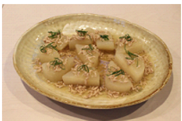
聖護院大根の風呂吹きそぼろあんかけ