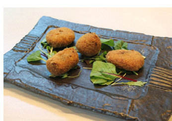
西京味噌コロッケ