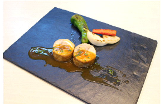
「きのこを詰めた鶏肉のインボルティーニ トリュフの香りポロセッコのソース 焼き京野菜を添えて」