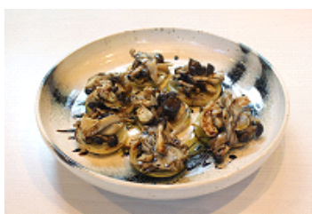
きのこのトリフォーラーテ