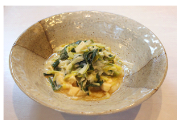
九条ネギと白ネギの酢味噌和え