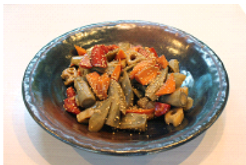
堀川ごぼうと根菜のきんぴら

冷製デリと温製デリを自由選べるデリ(惣菜)プレートランチにも、2015年12月1日(火)より冬の京野菜を織り交ぜた新デリメニュー11種類(冷製・温製合わせて)が登場します。