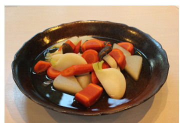
京野菜のたいたん