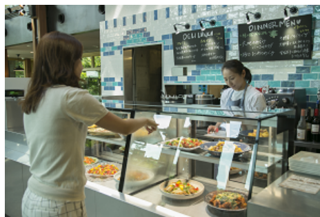
ショーケースの中から好きなデリ(惣菜)をお選びいただけます。

※冬期デリ(惣菜)メニューの提供期間 : 2015年12月1日(火)～2016年2月29日(月)