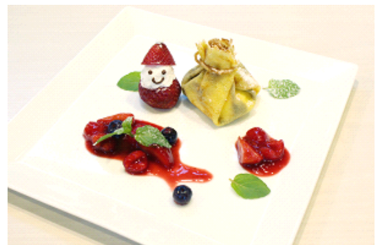
「サンタクロースからのおくりもの」