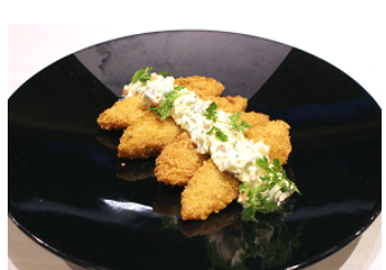
魚のフライ 京野菜ピクルスのタルタルソースで