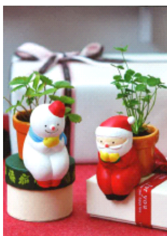
「京野菜ツリー」(左) ※1 とクリスマス雑貨 (右) ※2

店内には京野菜のオーナメントで飾り付けられた「京野菜ツリー」が登場するほか、併設するショップではサンタクロースや雪だるまなどをモチーフにしたクリスマス雑貨を販売し、店内がクリスマスの雰囲気です。