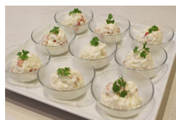
ポテトサラダ ツリー仕立て