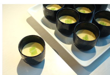
聖護院かぶらの冷たいフラン