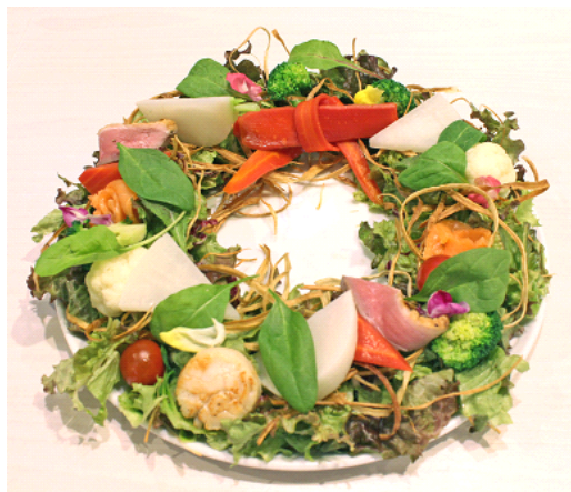
新メニュー「京野菜レストランのクリスマスリース ～西京味噌ドレッシングとともに～」