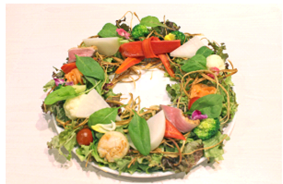
「京野菜レストランのクリスマスリース ～西京味噌ドレッシングとともに～」