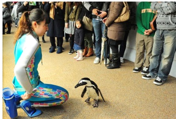
「ペンギンゾーン」を飛び出しペタペタとお散歩