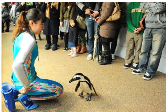
赤ちゃん誕生をお祝いして「ペンギンペタペタタイム」を開催

「ハッピーペンギンベイビーズ！」では、赤ちゃんの健康管理のために行う体重測定の様子を特別に公開し、赤ちゃんの成長を実感していただきながら、間近でその愛らしい姿をご覧いただけます。また、飼育スタッフと一緒に赤ちゃんや親鳥を観察して、様々なエピソードを聞くことができます。