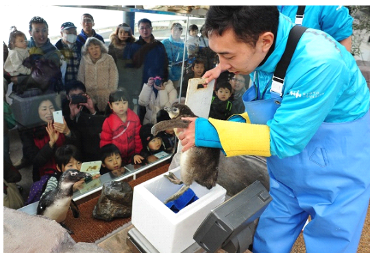
大きくなったかな? 赤ちゃんペンギン体重測定を特別公開