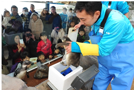
赤ちゃんの成長を実感できる体重測定を特別公開

飼育スタッフに抱えられて体重計に乗る様子や、日々増える体重から赤ちゃんの成長を実感することができます。ふわふわとした赤ちゃん特有の羽「綿羽(めんう)」に包まれた愛らしい姿を間近でご覧いただけます