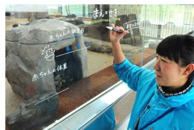
飼育スタッフが綴る赤ちゃんの成長記録