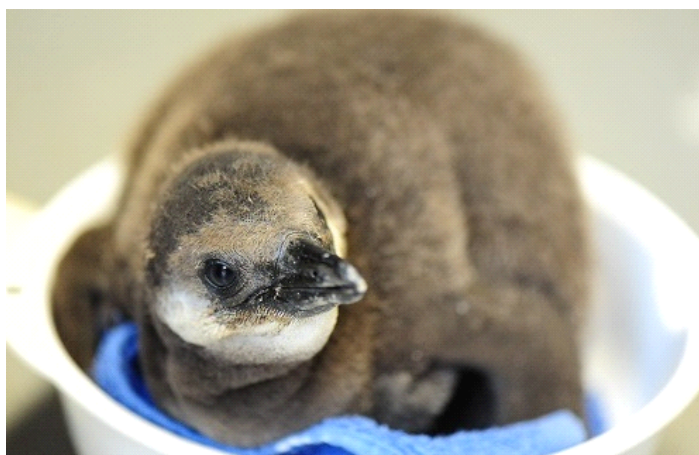
続々と誕生している「ケープペンギン」の赤ちゃんたち

現在「ペンギンゾーン」では、巣箱の中で赤ちゃんが親鳥に守られながらすくすく成長している様子を展示通路からのぞき込んでご覧いただくことができます。