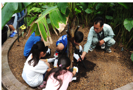
第1回連携ワークショップ 『ゾウさん、オットセイさんのウンチでバナナを育てる』 実施の様子

3園館包括交流連携協定 連携ワークショップでは、これまでに京都市動物園のゾウと京都水族館のオットセイのウンチから肥料ができることや植物に対する肥料の役割について学ぶ『ゾウさん、オットセイさんのウンチでバナナを育てる』や、いきもの全般に関する質問や相談にお答えする『夏休みの宿題いきもの相談会』、「いきもの大きさ」をテーマにした体験学習プログラムを各施設が実施した『いきものスケール』など、3園館が専門性を活かした連携ワークショップを開催しました。