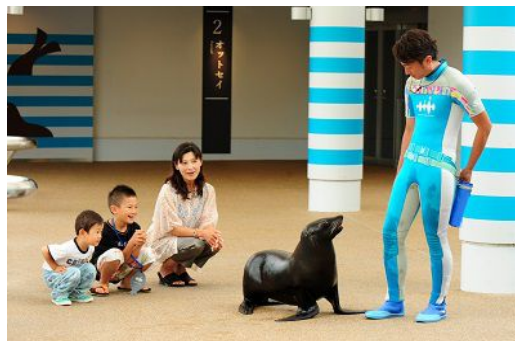
初開催！オットセイのお散歩タイム「ぶらりオットセイ」

ミナミアメリカオットセイやケープペンギンが展示エリアを飛び出しお客さまのすぐそばまでやってくるお散歩タイムを開催します。ガラス越しではない間近で息づかいまで感じることで、愛らしい姿や仕草にいきものたちの魅力をより体感することができます。