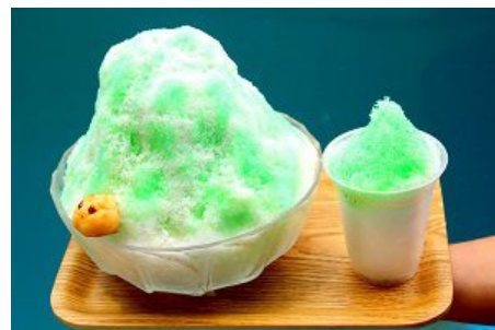
ゾウガメのように大きなメガサイズのかき氷はシェアにぴったり