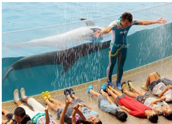
イルカと一緒にずぶぬれになって遊ぶ新感覚の夏限定プログラム

イルカスタジアムの屋根に設置した幅約 15mの巨大ウォーターカーテンから次々と形を変えながら流れ落ちる水とイルカがコラボレーションし、イルカの近くで水しぶきを浴びながらずぶぬれになって楽しめる、これまでにない新感覚のウォーターアトラクションプログラムです。「スーパースプラッシュ!!エリア」では、あおむけのポーズを見せるイルカたちと同じポーズで寝転ぶと上から巨大ウォーターカーテンの水やイルカのいたずらによる水しぶきが落ちてくるなど、夏の暑さを吹き飛ばす水遊びをイルカと一緒にしてお楽しみいただけます。