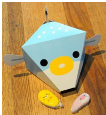
海のいきものぼうしをかぶって水族館を楽しもう

コクヨのテープのり「ドットライナー」を使って海のいきものたちの帽子を作るワークショップ。京都水族館で人気のイルカやペンギン、フグに加えてゾウガメの帽子も登場！かぶって歩けばより水族館を楽しめます。またタイアップ記念として、海のいきものをモチーフにした限定デザインの「ドットライナー AQUA」を各日先着40名さまにプレゼントします。