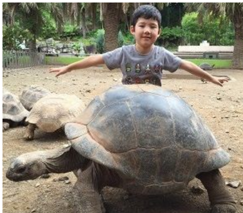
アルダブラゾウガメ