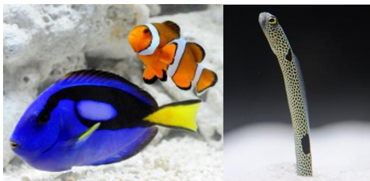
館長と一緒に人気のいきものをじっくり観察しよう

さんご礁のいきものエリアでは、普段は入れない飼育スタッフ専用ヤードに入り、人気のいきものカクレクマノミやナンヨウハギ、チンアナゴにごはんをあげて食べる姿を観察することができる「館長のおさかな教室」を開催します。館長に直接質問することができ、夏休みの宿題にもぴったりです。