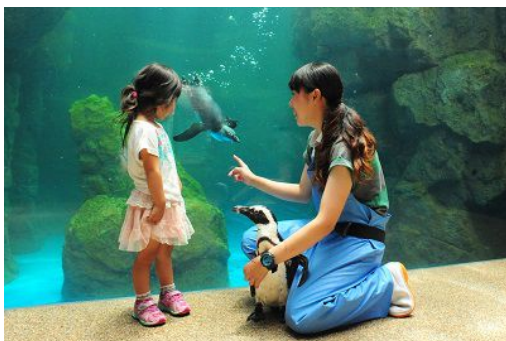
ペンギンたちがすぐそばにやってくる「ハロー！ペンギン」