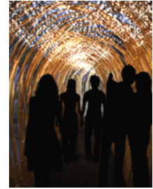
輝きの道イメージ

イルミネーションデザイン監修:照明デザイナー/NAIKIDESIGN INC.内木宏志