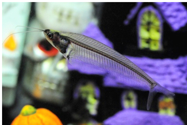
「ハロウィーンすいぞくかん」より「ブラックゴースト」(左)、「トランスルーセントグラスキャット」

「京都水族館」(京都市下京区、館長:下村 実)は、ハロウィーンイベントとしてハロウィーンをイメージしたいきもの特別展示や仮装して来館するとプレゼントがもらえるキャンペーンなどを実施する「ハッピーハロウィーン!京都水族館」を2016年10月1日(土)～10月31日(月)の期間に開催しますのでお知らせします。