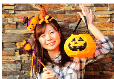
「仮装して京都水族館へ行こう！」仮装イメージ

「ハッピーハロウィーン！京都水族館」の開催期間中、帽子やマントなどハロウィーンアイテムを身に付けて来館するとオレンジ色のオリジナルハロウィーンホイッスルがもらえるほか、館内でソフトクリームをご購入いただいた方には通常の1.5倍のボリュームでご提供します。