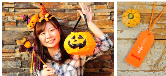
仮装して来館するとプレゼントや特典が受けられます

そのほか、ハロウィーンアイテムを身に付けて来館するとプレゼントや特典を受けられるキャンペーンや、館内の展示とあわせてお楽しみいただけるハロウィーン仕様の体験プログラムなど、期間中はさまざまなイベントで館内が賑わいます。この時期ならではの雰囲気にもまれる京都水族館で、水族館のハロウィーンをぜひお楽しみください。