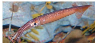
※イメージ(実際に展示するイカの仲間とは異なります)

『スプラトゥーン 2』に登場するキャラクター「インクリング」のモデルであるイカの仲間を特別展示します。通常は展示していない「アオリイカ」などのイカの仲間をじっくりと観察できるほか、生態に関する解説パネルでイカについて楽しく学ぶことができます。