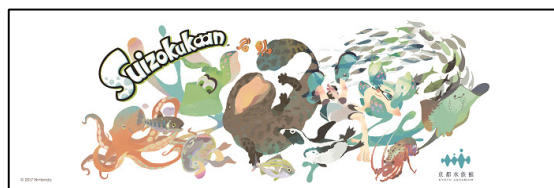
「Suizokukaan～イカす夏休み～」オリジナルてぬぐい(イメージ)

「Suizokukaan～イカす夏休み～」オリジナルアートが描かれたてぬぐいに館内4カ所に設置されたインクなどのキュートなスタンプを押して自分だけのてぬぐいを完成させる体験プログラムです。