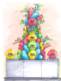
Suizokukaan ツリーを特別展示

「Suizokukaan～イカす夏休み～」オリジナルの描き起こしアートがプリントされた限定Tシャツやトートバッグをイベントオリジナルで販売します。また、オオサンショウウオのぬいぐるみとイカのぬいぐるみで制作されたSuizokukaan ツリーを特別展示します。