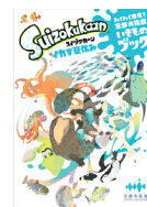
シール付き(イメージ)

クイズにチャレンジしたり、見つけたいきもののシールを貼って京都水族館を楽しむことができる「わくわく発見！京都水族館いきものブック Suizokukaan～イカす夏休み～」が登場します。