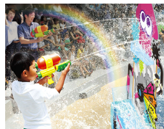
「スプラシューター」の水鉄砲を使って楽しむシューティング・バトル(イメージ)

「スイゾクカーン・スプラッシュタイム」は、イルカスタジアムに流れ落ちる幅約15mの巨大ウォーターカーテンの水と、ゲーム内に登場するブキ「スプラシューター」の水鉄砲などを使ってシューティングバトルし、親子で全身ずぶ濡れになって楽しめるイベントです。