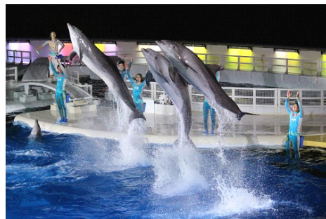
「イルカ nightLIVE きいて音(ネ)」