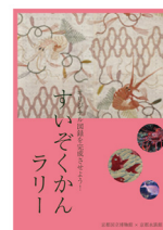
すいぞくかんラリーシート