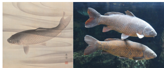
「龍門図」(円山応挙筆)とコイ

京都国立博物館にて開催される「京博すいぞくかん～どんなおさかないるのかな～」の展示作品に登場する実際のいきものを京都水族館内に展示し、作品といきものに関するパネル展示を行います。