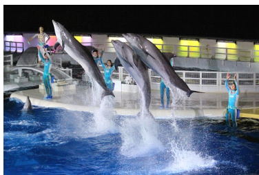
「イルカ nightLIVE きいて音(ネ)」

色鮮やかなLED 照明を使ったムービングライトやスポットライトの中、昼とは違った夜ならではの演出でご覧いただけます。