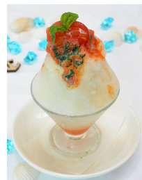
賀茂トマトとバジルの練乳がけ氷

見た目にも涼しげな夏限定のスイーツ「涼を感じるかき氷」を2017年7月1日(土)より販売します。京野菜である完熟の賀茂トマトとさわやかなバジルの風味が重なり合い絶妙な味わいを生む「賀茂トマトとバジルの練乳がけ氷」やマンゴーの果肉を大きくカットしマンゴープリンも一緒にお楽しみいただける「マンゴーかき氷」の2種類です。