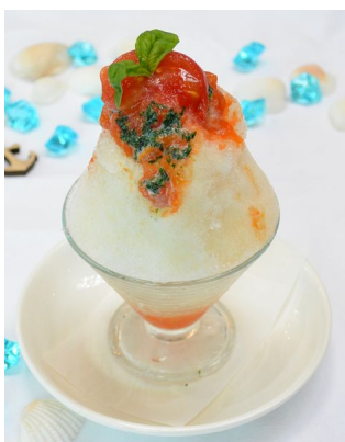
賀茂トマトとバジルの練乳がけ氷