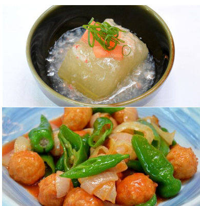
夏らしいデリ(惣菜)がそろいます