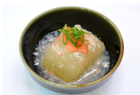
冬瓜ズワイガニあんかけ