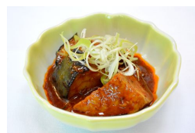
賀茂なすのマーボー風

販売価格 : デリプレートランチ(冷製デリ2種、温製デリ1種) 1,000円(税込み)