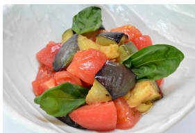
賀茂なすとトマトのイタリアンマリネ