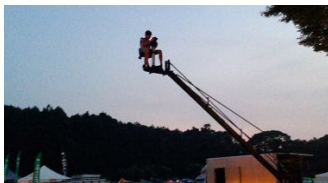
「クレーン体験」イメージ

映画を撮影する際に高い視点からの撮影で使用するクレーンが登場し、実際にクレーンに座ってカメラマンの気分を味わうことができます。映画の世界を体感できるとともに、梅小路公園周辺の景色をいつもと違った視点で楽しむことができる希少な体験です。