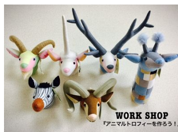
「遊ぶの教室」イメージ