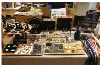
「ワンダーバザール」イメージ

期間中入れ替わりでさまざまな店舗が出店する蚤の市「ワンダーバザール」では、アクセサリーや布小物、アンティーク家具などの選りすぐりの品が集まります。「遊ぶの教室」では「遊ぶ・楽しむ・作る」というコンセプトのもとワークショップを体験できます。さらに、「ヤムヤムマーケット」は、こだわりの手作りパンや焼き菓子屋など、毎日違うさまざまなおいしいごはんのお店が連なり、一日中楽しむことができます。