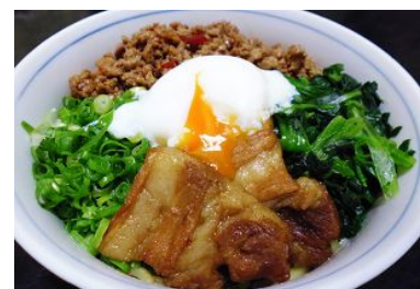
「YUM YUM MARKET (ヤムヤムマーケット)」イメージ

※店舗一覧および出展日程については「京都・梅小路みんながつながるプロジェクト」ウェブサイトをご覧ください。