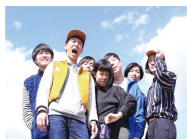
バレーボウイズ (10月8日)