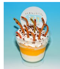
「ちんあなごだらけパフェ」