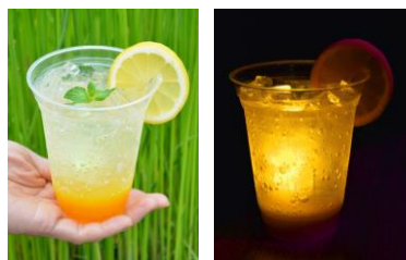
ホタルの光をイメージしたドリンク