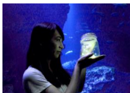
ほたるあそび(イメージ)