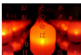
京のほたることば

ホタルの生態や特徴を解説するほか、「ホタルは光る、そして鳴かない」「声に出さないメッセージ聞こえへん？」などの京ことばで解説します。透明の箱にホタルからのメッセージが書かれており、ランタンの光で浮かび上がるメッセージを読むことができます。