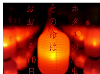
京のほたることば