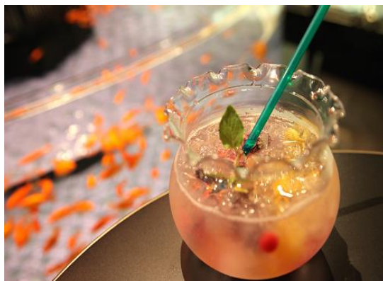
金魚ソーダ(イメージ)

かわいらしい金魚鉢型の容器にフルーツカクテルとベリーが入った期間限定メニューです。夏にぴったりな、爽やかな甘さを味わうことができます。容器はお持ち帰りいただくことができます。