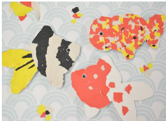
自分だけの金魚を生み出そう！

金魚のかたちをした台紙に赤・白・黒などの色の紙を貼り合わせ、自由な発想と想像で自分だけの新しい金魚を生み出す体験プログラムです。