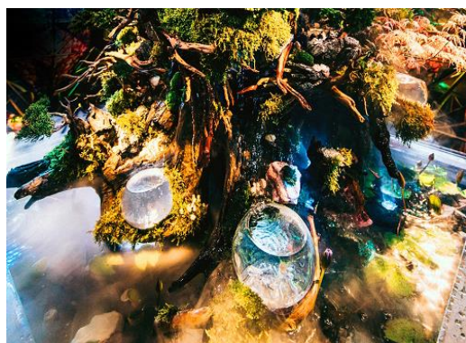
「京都金魚伝説」(イメージ)

「太古の京都の森と泉」をイメージし、流木や植物などがダイナミックにレイアウトされた水中世界と陸上世界が融合した全高約3メートルの大型展示を行います。水槽には尾びれが長く美しい金魚(コメット)が50匹泳ぎ、まるで森の中を妖精が舞っているかのような幻想的な水中世界が現れます。ミスト、滝、照明演出などを駆使した展示は見る時間ごとに印象が変わる楽しさがあるとともに、自然やいきものの美しさと力強さを感じることができます。