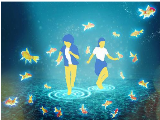
人の動きに合わせて映像が変化します

新システム「スマッチ」を使った体験型のアトラクションです。水と合わさるリズムカルな金魚の姿が見事に再現され、その優美さに惹き込まれるとともに、触れようとする金魚が逃げたり、足跡が波紋となって広がるなど、人の動きに合わせて変化をする遊び心満載の仕掛けで、臨場感あふれる水の中の世界を体感できます。