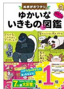
ぬまがさワタリの ゆかいないきもの(秘)図鑑 (西東社)

2016年から突然WEBでふしぎな生きもの図解イラストを発表し始め、ツイッターフォロワー数約7万人超えの大反響をよんでいる。『ぬまがさワタリの ゆかいないきもの(秘)図鑑』(西東社)などを刊行し、好評発売中!