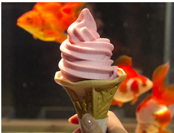
金魚ソフトクリーム(イメージ)