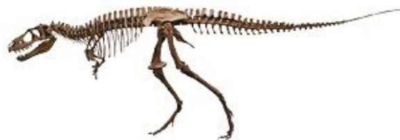
ティラノサウルスの仲間「ゴルゴサウルス」