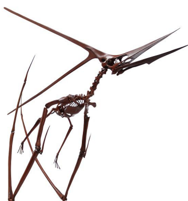
(左)「ケープペンギン」と(右)翼竜の仲間

「ペンギンゾーン」では、鳥類に姿がよく似た翼竜の仲間の全身骨格標本と、現代の鳥類であるペンギンとの体のつくりの違いなどを紹介します。これらの骨格標本とペンギンとを比較しながら、空を飛んでいた翼竜と飛べない現代の鳥類ペンギンとの違いについて学ぶことができます。