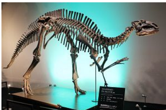
今にも歩き出しそうな迫力と臨場感

「エントランス」では植物食恐竜「イグアノドン」の仲間である全長約 5m の福井の恐竜「フクイサウルス」の全身骨格が来館者を出迎えます。圧倒的な大きさと迫力にこれから始まる「恐竜たちと水族館」の旅へ期待が膨らみます。