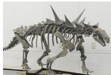
(左)「オオサンショウウオ」と(右)「アニマンタルクス」