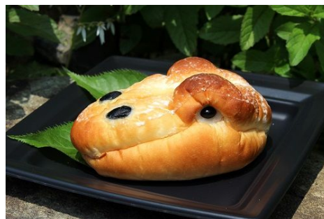
食べてもおいしい表情豊かなパンの恐竜