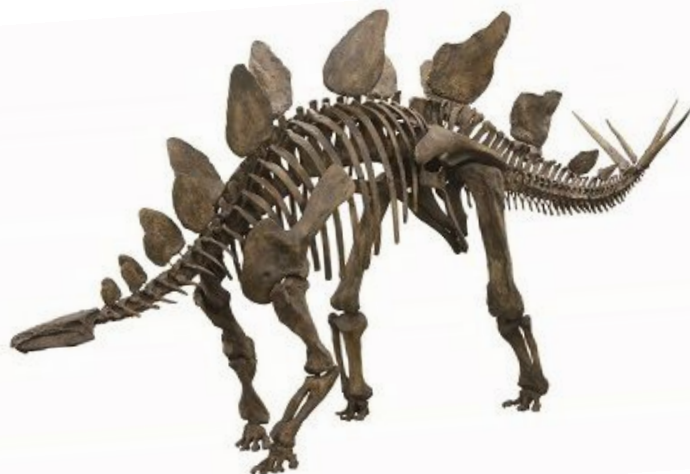
全長 6m の大きさは圧巻！「ステゴサウルス」

「交流プラザ」には、背に板状の骨が並ぶ姿で知られる全長約 6mの「ステゴサウルス」や、ティラノサウルスの仲間全長約 6mの「ゴルゴサウルス」の全身骨格標本が登場します。さらに、恐竜と形質が似ているは虫類の「ヒョウモントカゲモドキ」の生体展示と比較することで恐竜と他のは虫類の共通点や相違点から、恐竜とは何かを紐解きます。