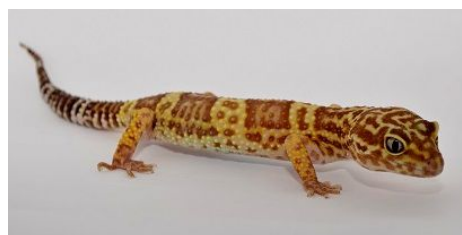
は虫類「ヒョウモントカゲモドキ」