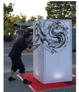
墨絵ライブイメージ

開催日：2017年8月6日(日) 開催時間：18時00分～18時20分(予定) 開催場所：中央広場