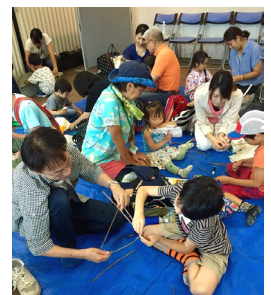
行灯をつくろう！イメージ