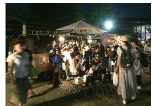
キッチンカーイメージ

開催時間：2017年8月5日(土)、6日(日) 14時00分～21時00分 開催場所：中央広場