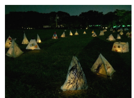
オリジナル行灯点灯イメージ