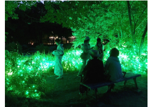
水辺のイルミネーションイメージ