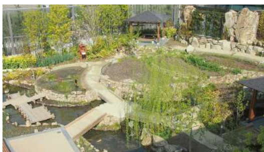
棚田や小川を再現した「京の里山ゾーン」

また、スペシャルワークショップでは、8ヶ月間毎月開催をする体験プログラム『京都水族館の里山教室』を開始します。第1回目は「田植え体験といきもの観察会」を実施します。