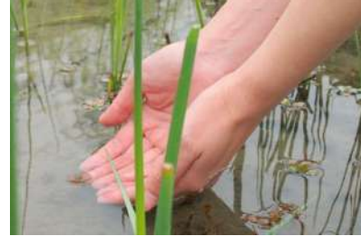
田んぼのいきものに触れてみよう

「京の里山ゾーン」では、活動を始めた多様ないきものたちを見るだけでなく、発見する「ワクワク」や、実際に触れる、「ドキドキ」を体感できます。里山の楽しみ方を、5つのスポットで紹介します。