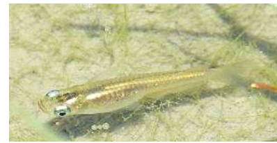
めだかも活発に泳ぎだします