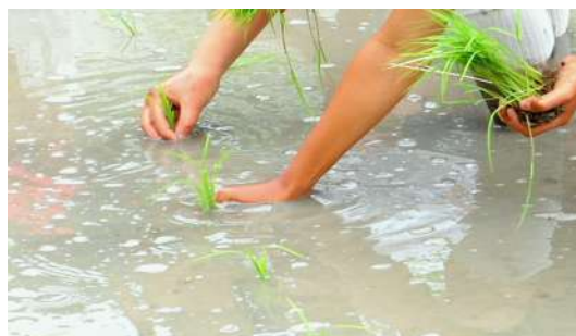
田植えといきもの観察会