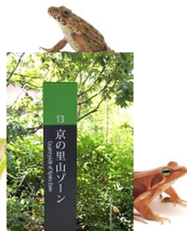
たくさんのカエルが待っています

また、カフェやショップでは、カエルにちなんだ商品が多数登場します。雨が多くなるこの時期、『京都水族館』ではたくさんのカエルに出会うことができます。