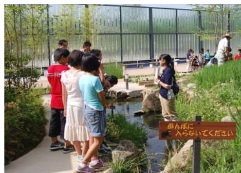
昨年の稲が育った田んぼといきもの観察会の様子

第2回目は、5月に植えた稲の成長記録の観察と、顕微鏡を使いたいきもの観察会を実施します。