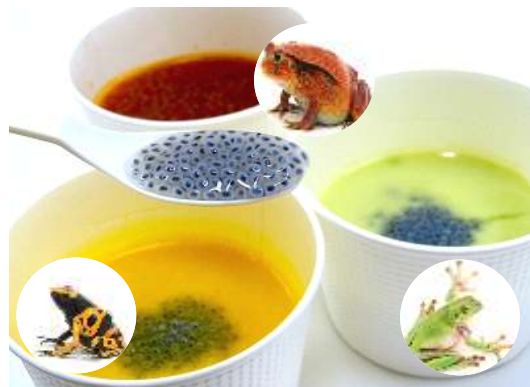
バジルの種は、カエルの卵にそっくりです