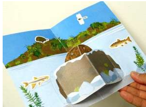
カードを開くと岩陰からオオサンショウウオが顔を出します

「オオサンショウウオ ポップアップカード」は、オオサンショウウオが暮らす環境と行動を、学びながら楽しく作るワークショップです。オリジナルの飛び出すカードを作ってみましょう。