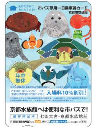
「市バス専用一日乗車券カード (京都市立芸術大学デザイン版)」