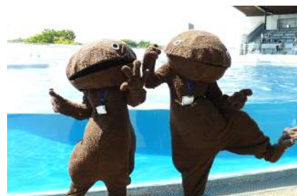
動きがとってもキュートなオオサンショウウオ

開催日時：2013 年 10 月 26 日(土)・10 月 27 日(日) 9 時 00 分～17 時 00 分