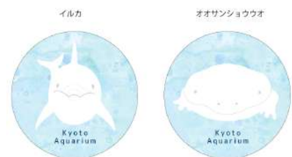
オリジナル缶バッジのイメージ

京都市立芸術大学院生がデザインした市バスに描かれている京都水族館のいきものシートに、いきものを観察しながら特徴をスケッチします。完成したシートで自分だけのオリジナル缶バッジを作成することができます。