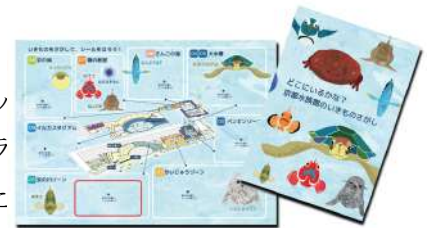
いきものシールとマップのイメージ

京都市立芸術大学院生がデザインした市バスに描かれている京都水族館のいきものを、館内を巡りながら探し、見つかったらいきものシールをマップに貼り付けます。その後、交流プラザに掲示しているラッピングバスのイラストとご自身で作成したマップをヒントにクイズに答えて応募すると、正解した方の中から抽選で合計104名様に、京都水族館オリジナル商品や、「市バス専用一日乗車券カード(京都市立芸術大学デザイン版)」をプレゼントします。