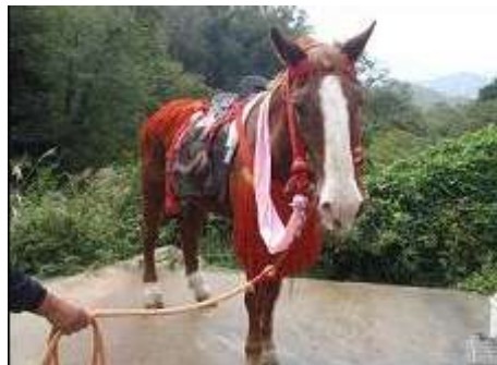
祭礼などに用いる華やかな馬具を装着した馬

また、水族館前の梅小路公園で、その華やかな馬具を着用した馬に乗ることができるイベントも開催します。