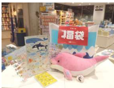
3,000円の福袋の中身の一例 必ずイルカのぬいぐるみが入っています。

350袋の数量限定で、「新春・京都水族館ワクワク福袋」を全2種類販売します。それぞれに京都水族館オリジナルグッズが必ず入っている、大変お得な福袋です。