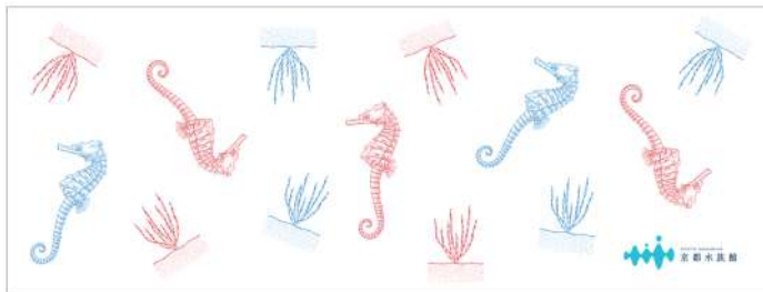
オリジナルの海の世界をつくってみよう。

ような顔をしているタツノオトシゴのスタンプが期間限定で登場します。京都水族館で生活するいきものたちを観察して、水槽や水族館をイメージしたオリジナルの手ぬぐいを作ってみてはいかがでしょうか。