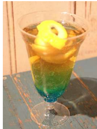
らせん状のレモンピールがアクセント

価格:600円(税込み) 販売場所:ハーベストカフェ 販売期間:2013年12月26日(木)~2014年1月13日(月・祝)