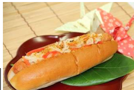
大根と人参でお正月をイメージした紅白を演出

価格:350円(税込み) 販売場所:ハーベストカフェ 販売期間:2013年12月26日(木)~2014年1月13日(月・祝)