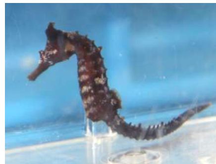
ストローのように長い口が可愛いタツノオトシゴ

まるで馬のように、湾曲した体形をしているタツノオトシゴや面長な顔をしているウマヅラハギなど、体の一部が馬に似ているのは、いきものたちの進化の過程に秘密が隠されています。その秘密や不思議な生態を、解説パネルとともにご覧いただけます。ひょうきんな表情をした、個性豊かないきものたちをぜひご覧ください。