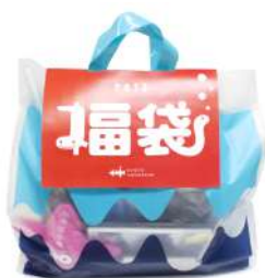
中身が見える！福袋