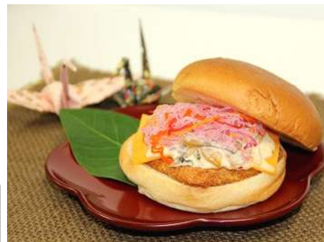
鮮やかな彩りの海藻ビーズをトッピング

価格:450円(税込み) 販売場所:ハーベストカフェ 販売期間:2013年12月26日(木)~2014年1月13日(月・祝)