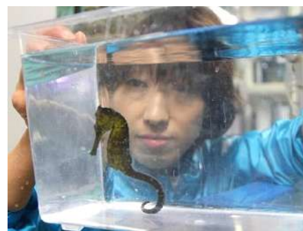
タツノオトシゴの仲間も登場します 水槽内のいきものをじっくり観察してみよう

長い口や尾が特徴のタツノオトシゴは、英名ではシーホース(海の馬)と呼ばれています。なぜ魚の仲間なのか?など、クイズを交えながら楽しく学ぶことができる約45分のプログラムです。また、ストローのように伸びた口で、小さな餌を食べる給餌の様子も観察することができます