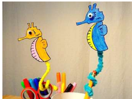
ぐるりと巻いた尾がポイントです。

タツノオトシゴは海藻などに尾を巻きつける行動をとることがあります。カラフルなモールを、タツノオトシゴの尾に見立て、オリジナルの可愛いタツノオトシゴ作りを楽しめます。尾を巻きつける行動にはどんな役割があるのか？タツノオトシゴの生態を楽しく学べるワークショップです。