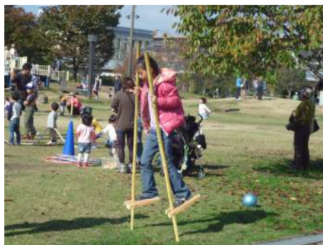
竹馬遊びのイメージ図

竹馬を作ったあとは、水族館前の梅小路公園で開催される、コマやけん玉を使った昔遊びなどを体験できる“梅小路公園プレイパーク”(10:00～15:00開催)の中で、実際に竹馬遊びを体験することができます。