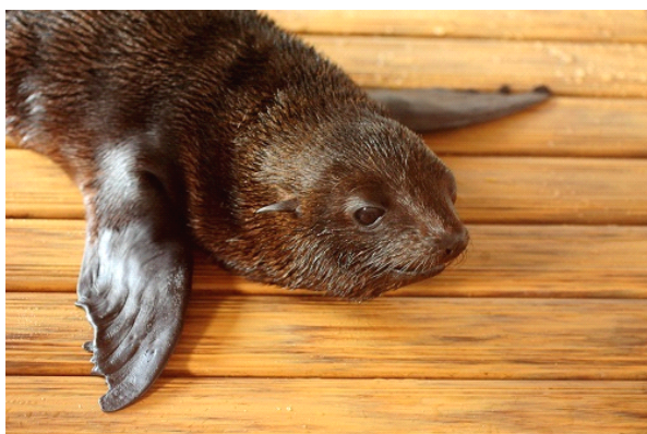
6月26日(日)に誕生したまだまだあどけないオスの赤ちゃん「あおば」