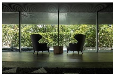
クロスホテル京都