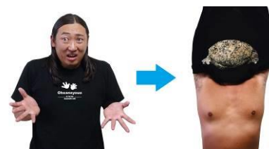
T シャツ (イメージ)

オオサンショウウオの日をより一層盛り上げるため、体モノマネ T シャツでお馴染みのロバート秋山 竜次さんとコラボレーションした、オオサンショウウオに変身する T シャツを販売します。幼児用のスタイのバージョンもご用意しているので、親子でお楽しみいただけます。京都水族館ショップとロバート秋山プロデュース体モノマネ「BOTY」公式オンラインショップ限定で購入可能です。