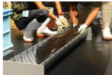
昨年の身体測定の様子