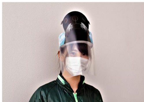
「いきものディスタンス」の取り組み（イメージ）

京都水族館（京都市下京区、館長：松本 克彦）は、営業を再開する2020年6月15日（月）より、当館で暮らすいきものに親しみをもちながら、館内での「三密回避」と「衛生管理」対策にご協力いただく取り組み「いきものディスタンス」を実施しますのでお知らせいたします。