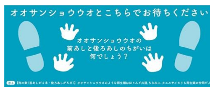
オオサンショウウオの足形シート（イメージ）

フロアシートには、いきものの足形に関するクイズを掲載し、順番待ちの際にもお楽しみいただけます。