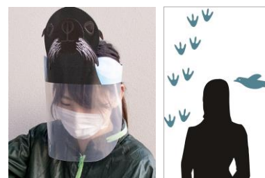
館内で使用するフェイスガード（左）、ビニールシート（右）（イメージ）

スタッフにも親しみを持っていただけるよう、飛沫防止のためにスタッフの一部が着用するフェイスガードやレジカウンターに設置するビニールシートに、オットセイやペンギンなど、さまざまないきものデザインをあしらいます。