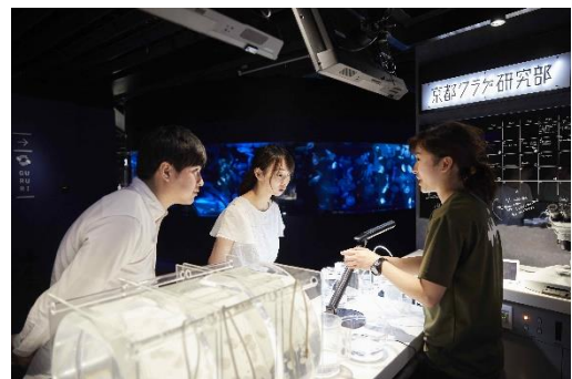
飼育スタッフと対話する「京都クラゲ研究部」(イメージ)

これまでバックヤードで行っていたクラゲの繁殖、研究などの作業を行うオープンスペースです。クラゲの繁殖や飼育方法は種類によって異なり、同じ環境下でも成長過程が変化することがあります。「京都クラゲ研究部」では、クラゲと日々向き合いながら研究に取り組む飼育スタッフならではの視点で解説します。また、クラゲにとって最適な環境づくりや日常の作業のようすを間近にご覧いただき、不思議なクラゲの生体を学んでいただける場所です。