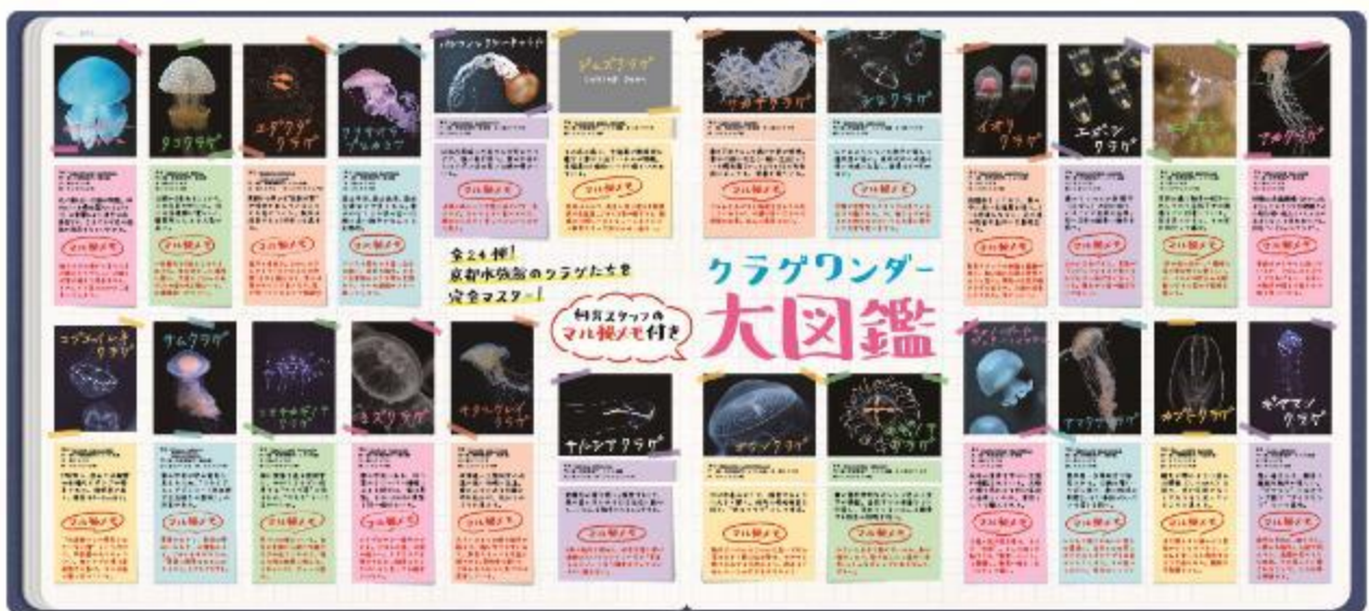
クラゲワッダー大図鑑（イメージ）