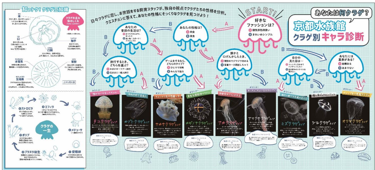
クラゲ別キャラ診断（イメージ）