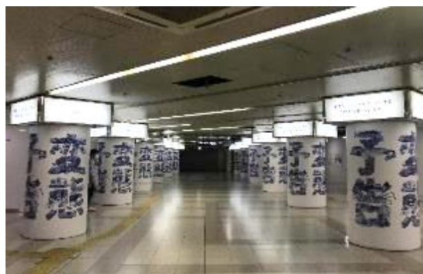
大阪市営地下鉄「梅田」駅 広告掲出のようす