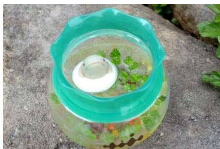
オオサンショウウオ鴨川ソーダ(イメージ)

昨年のオオサンショウウオイベントで販売したドリンクメニューが、今年も復活します。公式 SNS では、「水面にちょこんと顔を出したオオサンショウウオの姿がかわいい」と話題になり、連日完売が続いた人気メニューです。カラフルな食べられる海藻ビーズが入ったアップルソーダに、オオサンショウウオのマシュマロを浮かべたインパクトあるドリンクは、お持ち帰り可能な、京都水族館ロゴ入りの金魚鉢型スーベニアカップで提供します。