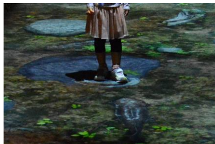
デジタル映像技術で演出された空間(イメージ)