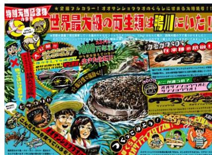
怪獣劇画風「オオサンショウウオ解説パネル」(イメージ)

オオサンショウウオが約3,000万年前から生息しているという背景から、まるでタイムスリップしたかのように、ワクワクしながら読んでいただける解説パネルを制作しました。鴨川で起きている在来種と交雑種の関係性や、雑食性のオオサンショウウオが自然界では何を食べているのかなど、迫力のあるイラストと色彩を用いて表現しています。昭和時代の漫画雑誌をイメージした怪獣劇画風デザインは、読み手の探求心をくすぐります。