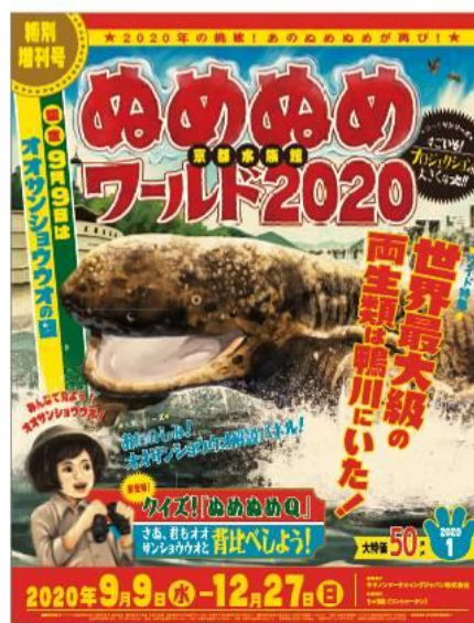
イベントポスター（イメージ）

そのほか、少しマニアックな質問も出題される、大型モニターでの映像を交えたクイズ『キミは答えられるか！クイズ！「ぬめぬめQ」』や、昨年SNSで話題となったオオサンショウウオのマシュマロを浮かべたドリンクメニューや新グッズも登場します。