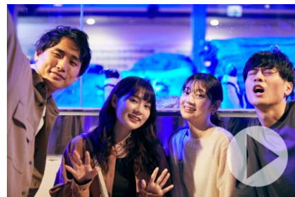
オリジナルムービー（イメージ）

開催に合わせて、オリジナルムービーを京都水族館公式 Youtube チャンネルや SNS で公開します。男女4人が実際に「夜のすいぞくかん」を楽しむようすを再現したストーリー仕立ての映像です。過ごし方の参考としてもご覧いただけます。