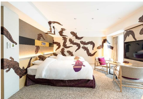
OH! san View Room ベッドルーム（イメージ）

「ORIX HOTELS & RESORTS」ブランドのシティホテル「クロスホテル京都」（所在地：京都市中京区、総支配人：桑野 隆史）および「京都水族館」（所在地：京都市下京区、館長：松本 克彦）は、オオサンショウウオをモチーフにした客室「OH! san View Room（オオサンビューールーム）」を企画し、2021年6月21日（月）よりクロスホテル京都にオープンしますのでお知らせします。また本日より、公式ウェブサイト（ https://www.crosshotel.com/kyoto/ ）にて、宿泊の予約受付を開始します。