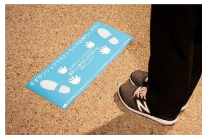
いきものディスタンス

2021年5月7日付の京都府「新型コロナウイルス感染症に係る緊急事態措置（延長）」の要請を受け、館内の収容率を50%以下に制限しています。また、厚生労働省「新しい生活様式」および公益社団法人日本動物園水族館協会「動物園・水族館における新型コロナウイルス感染対策ガイドライン（改訂第3-1版）」などのガイドラインに基づき、一部プログラムの休止や入館前のサーモグラフィーによる検温の実施、定期的な換気などの「三密回避」と「衛生管理対策」に取り組んでいます。