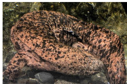
京都水族館のオオサンショウウオ

京都水族館では、開業当初から地元鴨川に生息するオオサンショウウオを展示し、生態や生息環境の情報発信に努めています。2018年4月には、一般社団法人日本記念日協会に「オオサンショウウオの日（9月9日）」を申請し、認定されました。また、展示だけにとどまらず、地元企業と連携し、京都市内でオオサンショウウオを乗せたタクシーやトロッコ列車を走らせる取り組みや、小学生を対象とした環境学習を実施するなど、オオサンショウウオを題材としたさまざまな展開を行っています。前足に4本、後ろ足に5本の指があり、その形の愛らしさから水族館の人気者です。