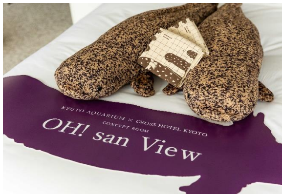
オオサンショウウオグッズ（イメージ）

「OH! san View Room」は、「オオサンショウウオの里帰り」をテーマとした1室限定のコンセプトルームとして、客室内の壁や天井、洗面ルームやバスルームなどに最大1.5メートル、40頭以上のオオサンショウウオの壁紙ステッカーを貼付しています。イラストや部屋のデザイン制作は、京都水族館の飼育スタッフ監修のもと、デザイン事務所 illustration&design YOSHIDAKEへ依頼しました。客室内をオオサンショウウオがぬめぬめと動き回っている様子とともに撮影をしたり、クローゼット内に隠れるオオサンショウウオを探しながらの滞在をお楽しみください。客室は47㎡と最大4名さままでご宿泊でき、バスルーム、洗面ルーム、トイレがそれぞれ独立し快適にお過ごしいただけます。当宿泊プランには、朝食のほか、オオサンショウウオのオリジナルグッズや京都水族館の入場券が含まれますので、京都水族館で本物にも出会える“オオサンショウウオづくし”の時間をお楽しみください。