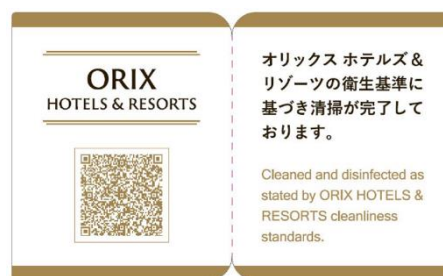
クリーンステイ・ルームシール（イメージ）

クリーンステイ・ルームシールは、客室をガイドラインに基づき清掃・消毒し、それらに加えてお客さまの手などが触れる頻度が高い箇所を専用クリーナーなどで丁寧に拭き上げたことを保証する目印です。客室清掃完了後、ドア部に貼付し、客室の衛生管理状態を確保します。