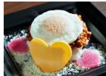
ハートのキーマカレー

おせち料理が続いたお正月明けなどにぴったりなスパイシーカレーが登場します。ハート形にくり抜いた鮮やかな紅色の紅芯大根とチーズをトッピングし、上に目玉焼きを乗せたボリューム満点のキーマカレーです。寒い時期に嬉しい、温かくスパイシーな味をお楽しみください。