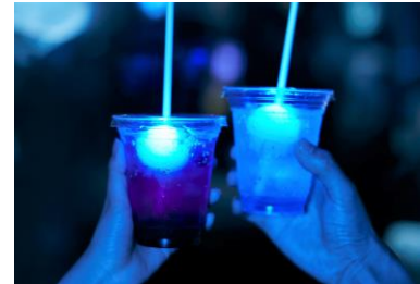
幻想的な館内にぴったりのソーダ

昨年の「夜のすいぞくかん」でも販売した、ソーダの中にクラゲの形の光るキューブを浮かべたドリンクが復活します。爽やかな見た目も綺麗なブルー（ブルーハワイ味）と、色鮮やかなレッド（カシス味）の 2 種類をご用意します。光るクラゲのキューブは、お土産としてお持ち帰りいただけます。