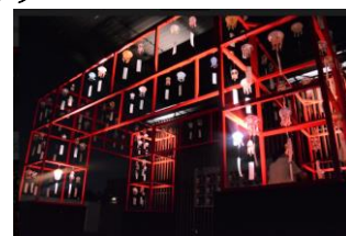
クラゲ風鈴の夜間ライトアップ

夜ならではの幻想的な空間でいきものと過ごすことができるイベント「夜のすいぞくかん」の開催日には、午後5時以降に「クラゲ風鈴」をライトアップします。温かい光が風鈴を照らし、日中とは一味違う雰囲気を演出します。「京の里山」エリアを散策しながら、夜風に響く風鈴の涼しげな音色をお楽しみください。