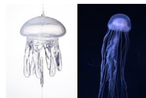
今年初登場の アトランティックシーネットル