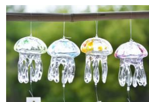
「TAKU GLASS」で販売の 「くらげ風鈴」