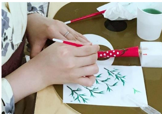
「和蠟燭」絵付け体験（イメージ）

京都水族館（所在地：京都市下京区、館長：松本 克彦）は、2022年11月12日（土）、13日（日）、19日（土）、20日（日）の4日間、京都の伝統工芸品である「和蠟燭(わろうそく)」の絵付け体験や「京こま」の制作体験ができるワークショップを開催しますのでお知らせします。