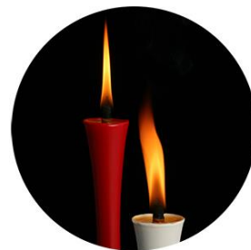
中村ローソク 和・京蠟燭