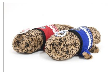
「お祭りオオサンショウウオ」 ぬいぐるみ 青・赤