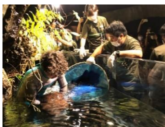
「測って！オオサンショウウオ」 2022年撮影