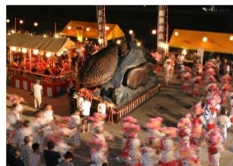
「はんざき祭り」のようす

また、国の特別天然記念物であるオオサンショウウオの保護を行う「はんざきセンター」では、より自然環境に近い状態の飼育環境が整えられ、オオサンショウウオを間近に観察できます。研究の歴史や地域住民との関わりなどの展示があり、湯原の生涯学習、観光の顔として多くの方に親しまれています。