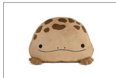
オオサンショウウオクッション