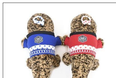
「お祭りオオサンショウウオ」 ぬいぐるみ 青・赤

本イベントは、当館で開館当初から飼育しているオオサンショウウオの生態とその魅力をより多くの方に伝えたいとの思いから、9月9日の「オオサンショウウオの日 ※ 」を地域一体で盛り上げるイベントとして2018年に初開催し、今年で5回目を迎えます。