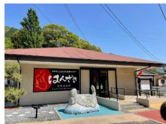
「はんざきセンター」