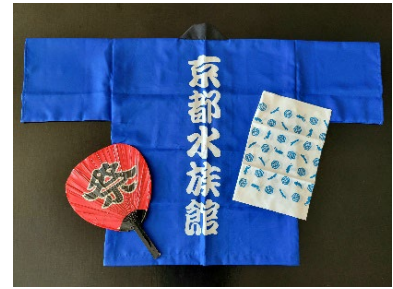
ツリーに使用した装飾品

今年は、9月9日の「オオサンショウウオの日」が、お客さまと祭りムードで大いに盛り上がったことから、「祭り」をテーマにしたオオサンショウウオツリーを展示します。装飾には、人気につき完売した数量限定グッズの『お祭りオオサンショウウオ』ぬいぐるみのほか、今年の「オオサンショウウオの日」のイベントのために特注で制作した法被と手ぬぐいや、祭りの雰囲気を演出するちょうちん、うちわ、水風船などを使用しました。水族館スタッフが手作業で組み上げた高さ約2メートルのオオサンショウウオツリーをぜひお楽しみください。