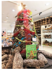
2021年テーマ：リサイクル