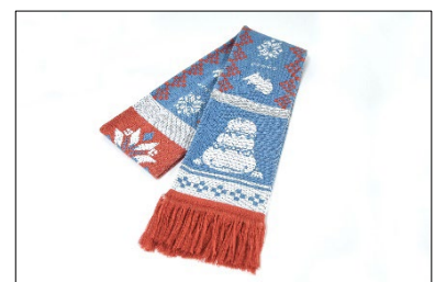
オオサンショウウオ マフラー

※11月22日（水）23日（木・祝）のミュージアムショップでの購入には入場券または年間パスポートのご提示が必要です。レジにてご提示ください。