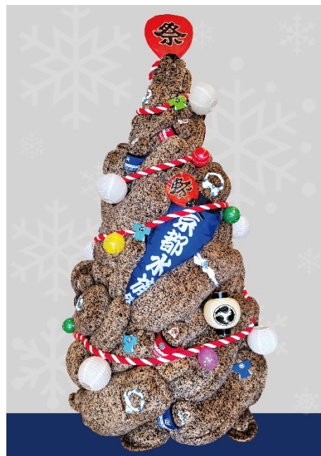
オオサンショウウオツリー2023