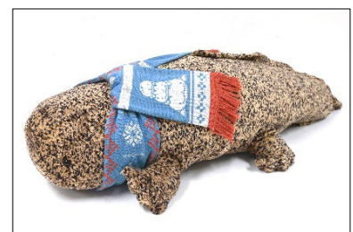
マフラー付きオオサンショウウオぬいぐるみ