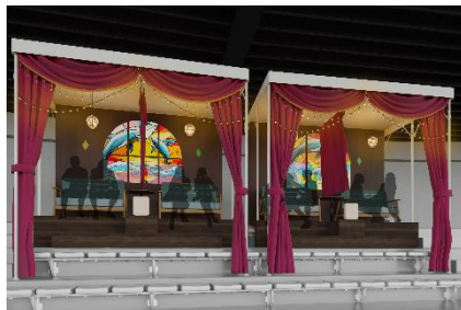
「スペシャルシート」（イメージ）