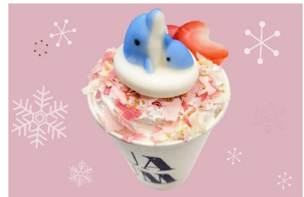
キアとツムギのあったかカフェラテ

本イベントは、昨年に開催した冬季限定イベントです。今年は、クラゲ展示エリアの「クラゲワンダー」と「イルカスタジアム」の二つのエリアに、温かな雰囲気でききものをお楽しみいただける空間が登場します。