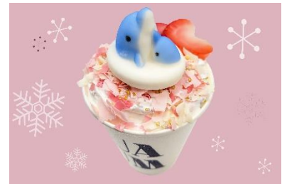
キアとツムギのあったか カフェラテ