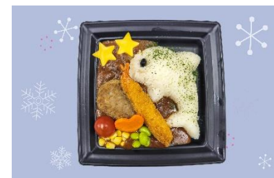
お子さまランチ風☆ドルフィンプレート