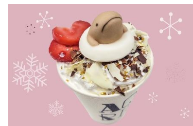
オオサンショウウオの あったかココア