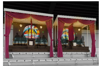
「スペシャルシート」(イメージ)

「イルカスタジアム」の特等席から眺めるイルカのようすと梅小路公園の景色をお楽しみください。