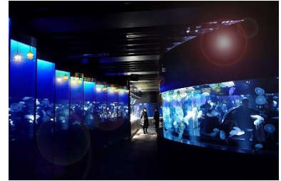
ミズクラゲの「クラゲランプ」 (イメージ)