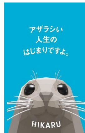
「ヒカルオリジナルステッカー」