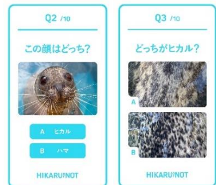
クイズ「HIKARU? or NOT」（イメージ）

壁面に設置するデジタルサイネージにて、「ヒカル」に関する2択クイズをランダムで出題します。問題数は最大10問出題され、正解数に合わせて称号が表示されます。館内に掲示されている「ヒカル」の情報、見分け方に注目し、全問正解の証しである「ヒカルチャンピオン」の称号獲得を目指しましょう。