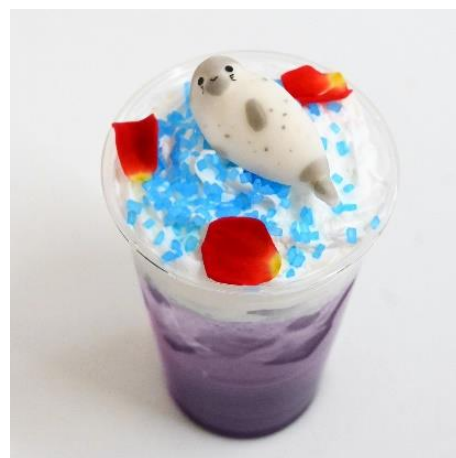
ふわふわヒカルのベリーソーダ