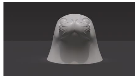
アザラシ「ヒカル」モニュメント（イメージ）

ブース内に入ると「ヒカル」をイメージした高さ約150cmの大型モニュメントがご来館のお客さまを出迎えます。インパクト抜群の「ヒカル」モニュメントと一緒に、ぜひ写真撮影をお楽しみください。