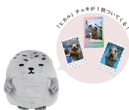
ノベルティ付き! アザラシぬいぐるみ 特大