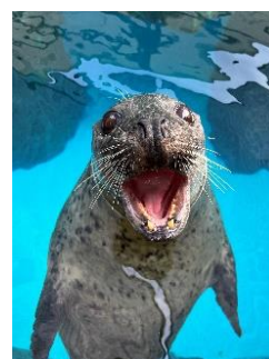
館長お気に入りの アザラシ「ヒカル」の写真

本プロジェクトは、京都水族館で働く飼育スタッフが期間限定ブース「小さな水族館」の館長に就任し、いきもの新たな魅力をお客さまにお伝えする企画です。飼育スタッフがブースの展示内容をプロデュースし、自身が愛するいきものの生態や特徴、好きなポイントについて紹介し、いきもの知られざる魅力や観察する楽しさをお伝えします。