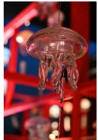
夜間ライトアップ (イメージ)

※2024年4月24日付リリース: 夜ならではのいきものの生態と幻想的な空間を楽しむ「夜のすいぞくかん」4月27日(土)スタート