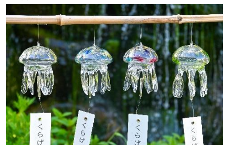
「TAKU GLASS」で販売の「くらげ風鈴」

※「TAKU GLASS」にて販売している商品のため、京都水族館で展示の「クラゲ風鈴」とは異なります。