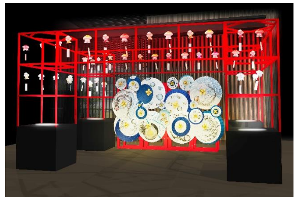
クラゲ京和傘空間が新登場（イメージ）

本イベントは、2021年の開催から今年で4回目となる京都水族館の夏季限定イベントです。期間中は、「ミズクラゲ」や「タコクラゲ」など24種のクラゲをモチーフにした約170個の「クラゲ風鈴」を展示するほか、今年は新たに「クラゲ京和傘」の展示空間が2階テラスに登場します。