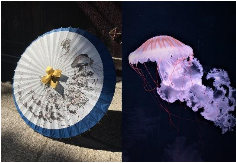
クリサオラ・プロカミア