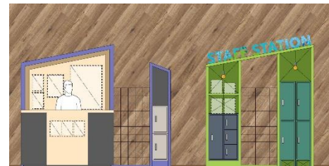
STAFF STATION (イメージ)