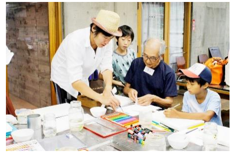
ワークショップ（イメージ）

※3 絶滅危惧種を守るため、安全な施設にいきものを保護して、それらを増やすことにより絶滅を回避する方法。