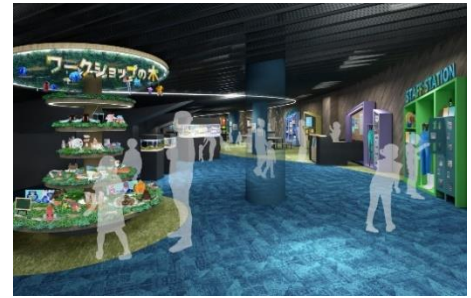
ミテッテ (イメージ)

展示水槽を囲うように配置した多数のテーブルとイスは、ワークショップやイベントの開催にあわせてレイアウトが変化します。また、展示を見ながらほっと一息つく休憩スペースとしてもご利用いただけます。