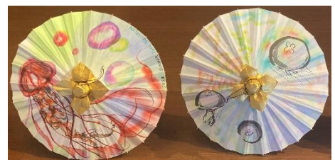
ミニ和傘完成イメージ