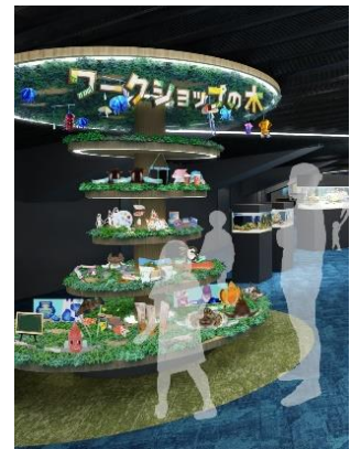
ワークショップの木 (イメージ)

フェイクグリーンやサンゴ砂、貝殻、流木などで装飾されたツリーには、開館 1 年目に実施した魚型の旗「おさかなフラッグ」づくりや、いきものを正面から観察する楽しさを伝える「魚面」づくりなど、これまでお客さまとともに制作した作品約 30 点を展示します。展示品の隣には当館飼育スタッフによる、いきものをもっと知ってもらう解説や開発に込めた思いも展示します。