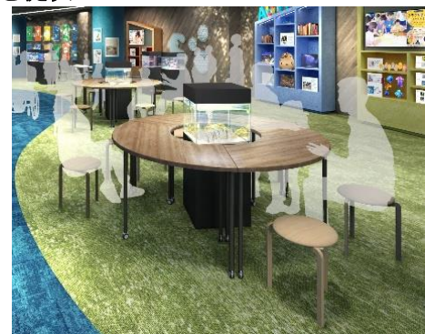
ワークショップスペース (イメージ)

レイアウト変更が自由自在なテーブルとイスを採用し、お子さま向けのワークショップだけでなく、特別講義や大人向けのワークショップなど、イベントにあわせた空間づくりが可能で、これまで以上に幅広い多種多様な体験をご提供していきます。