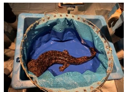
全頭測定会のようす (2023年撮影)