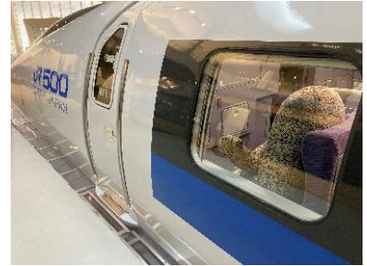
京都鉄道博物館 本館 1 階 521 形 1 号車（500 系新幹線）など 9月7日～10月31日