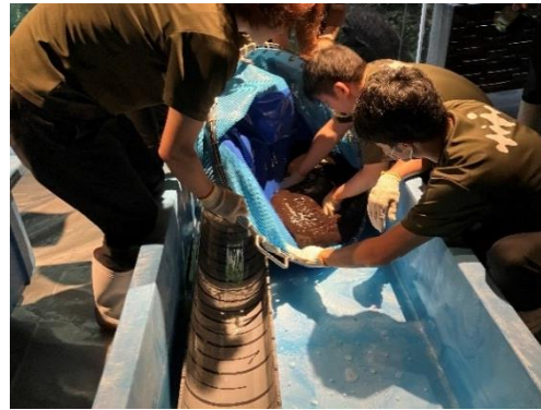
「測って！オオサンショウウオ」イメージ (2023年全頭測定会のようす)

京都水族館は、開館当初より飼育しているオオサンショウウオの生態と魅力をより多くの方にお伝えしたいという思いから、9月9日を「オオサンショウウオの日 ※ 」とし、2018年から地域一体でオオサンショウウオの日を盛り上げるイベントを開催しています。6回目を迎える今年は、9月7日（土）～9日（月）の3日間にわたり、多様なイベントをお楽しみいただけます。