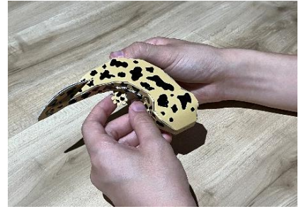
オオサンショウウオクラフト体験 (イメージ)