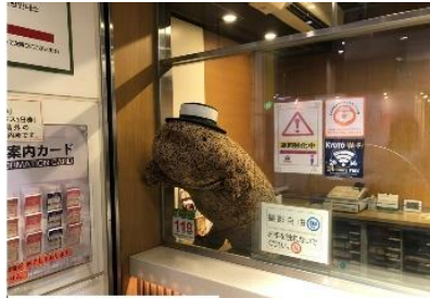
※2023年実施の様子 京都駅ビル開発株式会社 和食小路「がんこ」 鉄道案内所・駅ビルインフォメーション 9月7日～9月30日