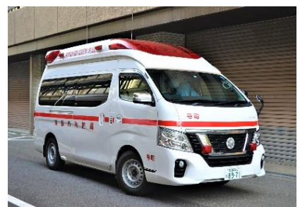
山車を先導する救急車