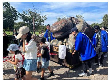
「オオサンショウウオ山車引き体験」 イメージ