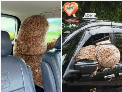
エムケイ株式会社 MK タクシー車内（3 台） 9月9日～9月30日 特典：乗車記念カード