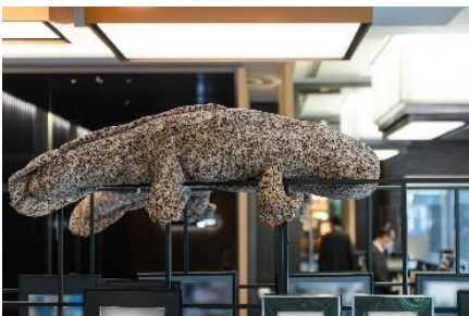
クロスホテル京都 1 階ロビーラウンジ、レストラン 9月9日～9月30日