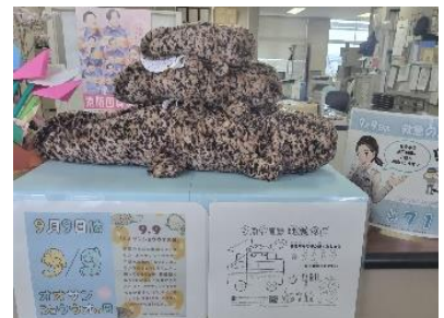
京都市各消防署 受付スペース 9月7日～9月30日