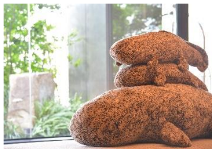
梅小路エリア各ホテル ロビーなど 9月7日～9月30日