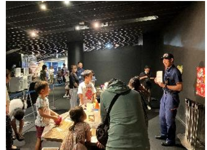
救急の日ワークショップ活動 (2023年京都水族館実施)