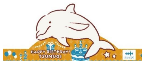
ツムギのバースデーお面 （イメージ）