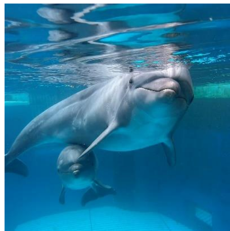
母親の「キア」と「ツムギ」

※ 当日の天候、設備、いきものの状況などにより、プログラムを中止する場合があります。