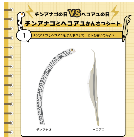
ワークシート（イメージ）