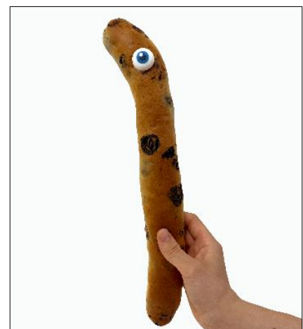
なが〜い！チンアナゴパン