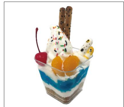
カラフルチンアナゴサンデー