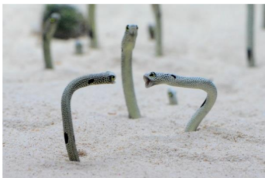
SNSでも人気のチンアナゴのけんかのようす

京都水族館（所在地：京都市下京区、館長：坂野 一義）は、2024年10月21日（月）～11月29日（金）の期間、11月11日の「チンアナゴの日※1」と「ヘコアユの日※2」を記念し、さまざまな展示やイベントを通してチンアナゴとヘコアユの生態や魅力をお届けする「チンアナゴの日 vs ヘコアユの日」を開催しますのでお知らせします。