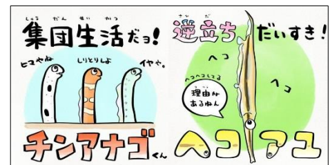
いきものの生態をイラストで紹介