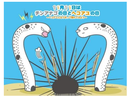
フォトスポット（イメージ）