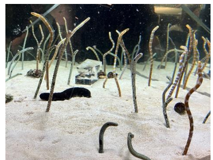
「チンアナゴのごはんの時間」

※11月10日(日)は「どっちが11(いい)?チンアナゴ vs ヘコアユ座談会」開催のため「チンアナゴのごはんの時間」「ヘコアユのごはんの時間」は実施しません。