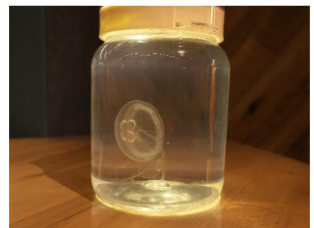
ふわふわクラゲ（イメージ）

生後約1カ月のミズクラゲを手元で観察できる体験「京都クラゲ研究部 冬の特別部活動『ふわふわクラゲ』」を日数限定で開催します。容器の中に入れたミズクラゲを手元で観察できるだけでなく、クラゲへごはんをあげることができます。クローバーのように見える胃袋がごはんの色に染まるようすや、ふわふわと漂うクラゲをじっくりと堪能することができます。体験の最後には、360度パノラマ水槽「GURURI」の成長したミズクラゲと生後約1カ月のクラゲを比較しながら観察を楽しみます。