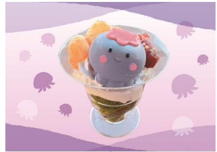
にっこりクラゲの和すいーつ