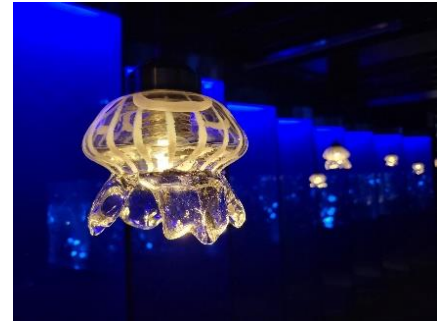
くらげのあかりたち（イメージ）

今年、クラゲ展示エリア「クラゲワンダー」内の3カ所で約60個のクラゲランプを展示します。生後2カ月までのミズクラゲの成長過程を観察できるプロログには、約15個のクラゲランプを展示し、お客さまをあたたかいあかりで迎えます。さらに約1,500匹のミズクラゲを展示する360度パノラマ水槽「GURURI」の外側には、ミズクラゲ型のランプをともし、本物のミズクラゲと見比べながらお楽しみいただけます。また、昨年ご好評いただいたエリアの一部の壁面を鏡で囲んだ「ミラートンネル」が登場し、鏡に反射するクラゲランプに包まれる幻想的な空間をご堪能いただけます。