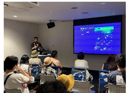
三宅教授特別授業（イメージ）

※応募多数の場合は抽選になります。当選された方には2025年1月10日（金）までにメールでご連絡します。