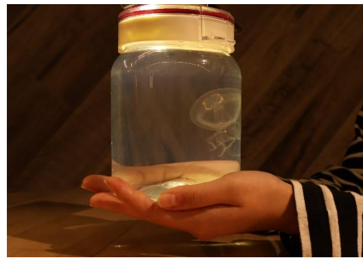
ふわふわクラゲ（イメージ）

「くらげのあかりたち」は、飼育スタッフ監修のもと当館で飼育する約20種のクラゲをモチーフに制作したクラゲランプを展示する期間限定イベントで、2020年から毎年開催し、今年で5年目を迎えます。