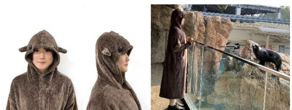
「着るほっとセイ」（イメージ）

「オットセイ」エリアの入り口には、子ども用と大人用のオットセイを模したガウンを設置しします。アシカ科の中では比較的耳たぶが長いことがオットセイの特徴です。長めの耳たぶと大きな目が付いた愛らしい雰囲気のある暖かなガウンを着て、オットセイ気分でお楽しみください。