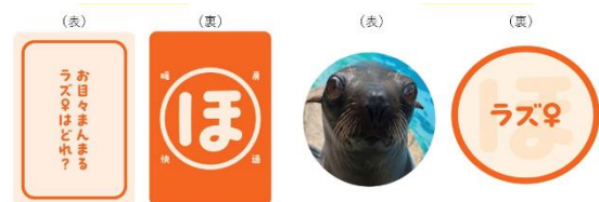
「オットセイかるた」（左：読み札、右：取り札）

こたつ型観覧席には飼育スタッフがそれぞれの個体の特徴を紹介した解説ブックとオットセイかるたを設置しします。個体を識別するかるたは難問です。イベント期間中、観覧席にオットセイ担当の飼育スタッフが訪れ、勝負する機会があるかもしれません。