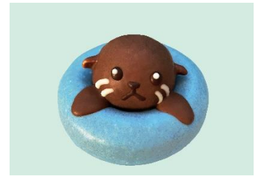
すいすいドーナツ「オットセイ」