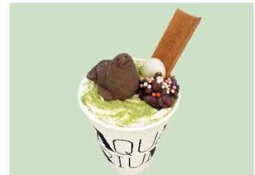
ぶかぶかオットセイの抹茶ラテ