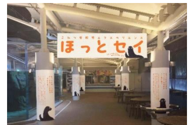
「ほっとセイ」エリアイメージ

オットセイ担当の飼育スタッフが日頃のコミュニケーションやトレーニングを行う中で感じた“ほっとする”エピソードをエリア内の柱の装飾パネルで紹介しします。さらに、個体ごとの見てほしいポイントや愛らしい一面、飼育する過程で遭遇したアクシデントなど約50個のトピックスを大型パネルで紹介しします。