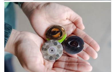
見つめ eye バッジ（イメージ）