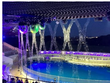
ウォーターカーテン

期間中の午後 7 時と午後 7 時 30 分の 2 回、「イルカスタジアム」にて水と光と音が織りなす空間アート「ウォーターカーテン」を上演します。夜しか見ることができない幻想的なアートパフォーマンスをぜひこの機会にご堪能ください。