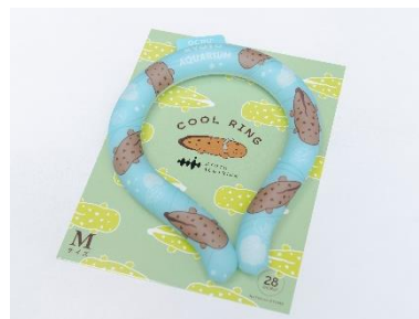
クールリング オオサンショウウオ