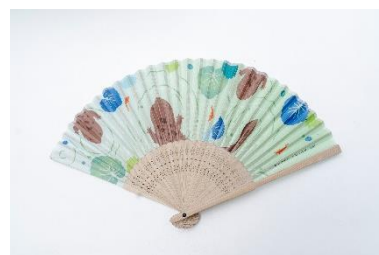
扇子 オオサンショウウオ