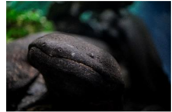
夜行性のオオサンショウウオ

夜になると、カップルや夫婦で寄り添って眠る可愛らしいペンギンたちを近くで観察することができます。互いにもたれ合って眠るペンギンたちもいれば、立ったままうとうとするペンギンも。個性豊かな寝方をご覧ください。