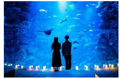
夜のすいぞくかん（イメージ）