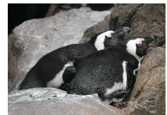
寄り添って眠る ケープペンギン