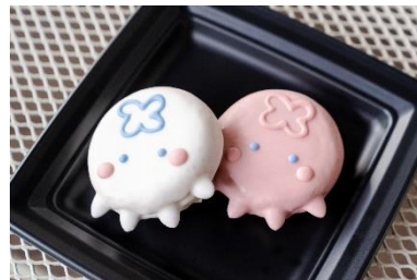
すいすいドーナツ クラゲ

当館の姉妹館であるすみだ水族館で販売中の「イクミママのどうぶつドーナツ®」から新作のクラゲが登場します。ミズクラゲをモチーフにしたドーナツは、ストロベリーチョコ味とホワイトチョコ味の 2 種類をご用意しました。