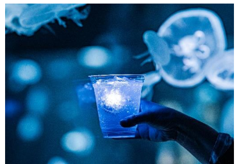
夜のすいぞくかん限定飲食メニュー

「夜のすいぞくかん」は、2017年から毎年開催している人気イベントです。本イベントでは、通常の営業時間を延長し、夜ならではのいきものたちの姿と照明演出による幻想的な空間をお楽しみいただけます。今年は、4月26日（土）～5月6日（火・祝）のゴールデンウィーク期間中、営業時間を午後8時まで延長します。午後5時以降は、館内のさまざまなエリアで照明を落とし、夜限定の照明で日中とはひと味異なる雰囲気でお楽しみいただけます。