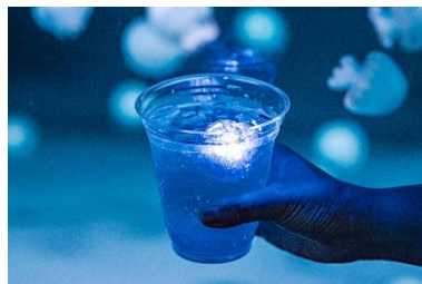
光る★クラゲソーダ

毎年「夜のすいぞくかん」開催日限定で販売している「光る★クラゲソーダ」が今年も登場します。ソーダは、見た目も爽やかなブルーハワイ味をご用意。ソーダの中には、クラゲ形の光るキューブを浮かべており、館内での記念撮影にもピッタリです。光るキューブは、お土産としてお持ち帰りいただけます。