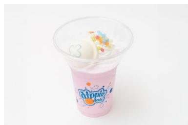
ふわふわクラゲのストロベリーシェイク

人気のアイス「ディッピングドッツ」がシェイクになって新登場。ストロベリー味のシェイクにホイップクリームとクラゲのマシュマロをトッピングしました。スイーツ感覚でお楽しみいただけます。